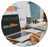
Data and Analytics